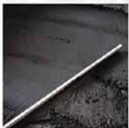
Пескобетон, грубый ровнитель