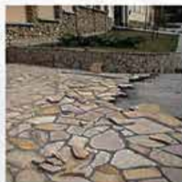
Клея для различных видов плитки