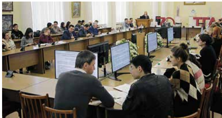
Начало на 10 стр.

Нижегородцы детально исследовали площадки КРТ, сделали историческую справку, определили природно-экологический каркас территории, подробно рассчитали потребность в инженерной, социальной инфраструктуре, планируемое транспортное обслуживание, все затраты застройщика и его прибыль.