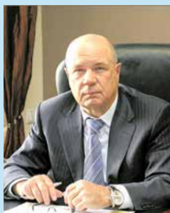
Мы выбрали самую важную профессию. Строить – значит расти, наполнять свою жизнь