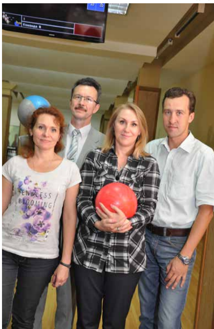
Команда ООО «Томскэкскавация» суждено ООО «ПКБ ТДСК» (из-за отсутствия в составе женщин команда потеряла 100 очков). Третье место заняла команда завода

На финише первыми были представители ЗАО «СУ ТДСК», которые и получили кубок за первое место. Второе место при-