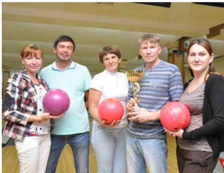
СУ ТДСК – победитель турнира

А теперь о ходе борьбы на дорожках. Резво стартовали проектировщики, после трёх игр набравшие 396 очков. В погоню за ними устремились команды СУ ТДСК (384 очка) и ЗКПД ТДСК (366 очков). Не спеша набирали очки команда Томскэкскавации (315 очков) и Томскстройзаказчика (309), рассчитывая на удачу в дальнейшем. После шести игр расстановки сил оставалась прежней.