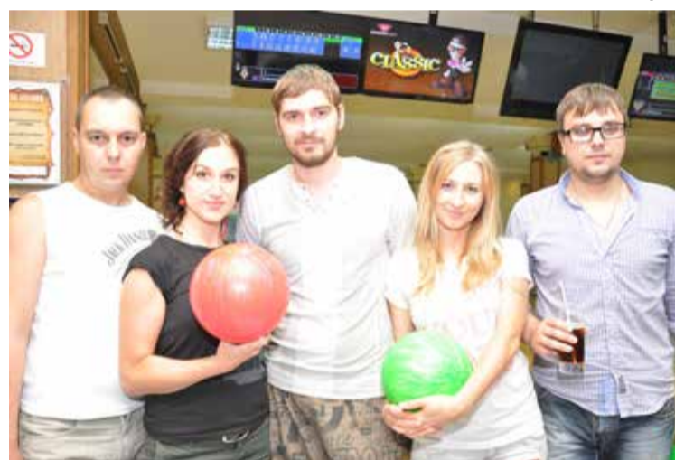
Завод КПД – на третьем месте

На финише первыми были представители ЗАО «СУ ТДСК», которые и получили кубок за первое место. Второе место при-