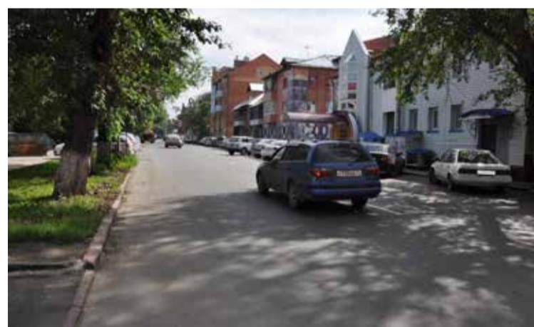
На улице Гагарина после ремонта дороги.