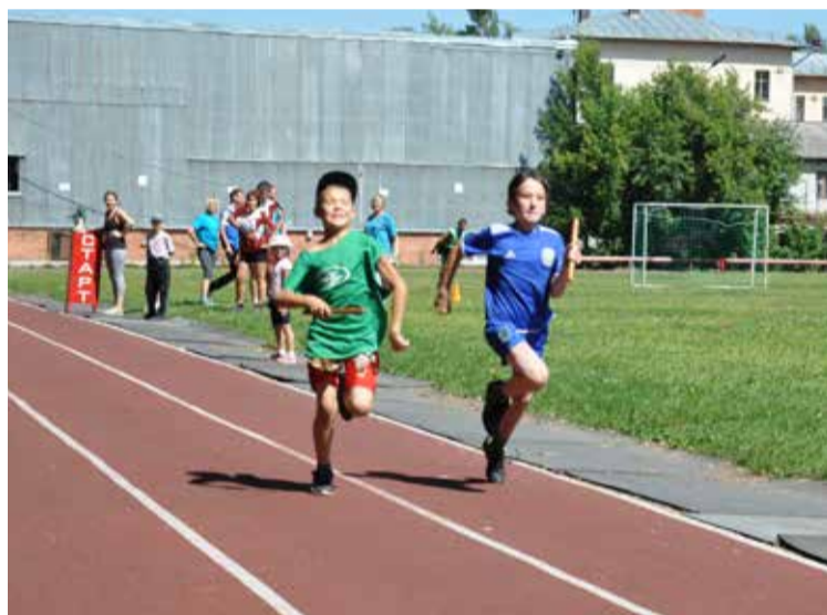
Семейная эстафета. Бегут дети