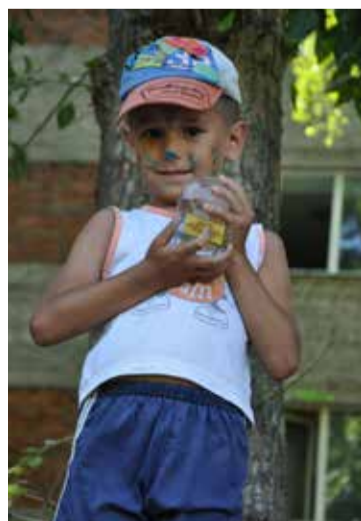
С мечтой о кубке