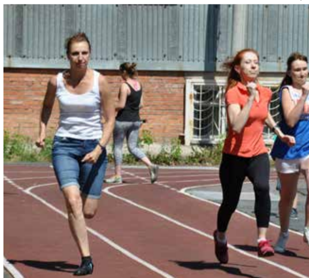
Начался забег среди девушек