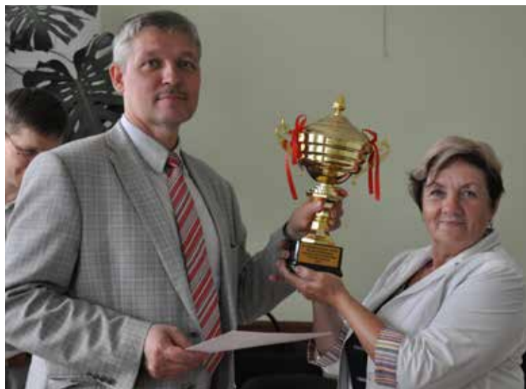
ТДСК главный кубок