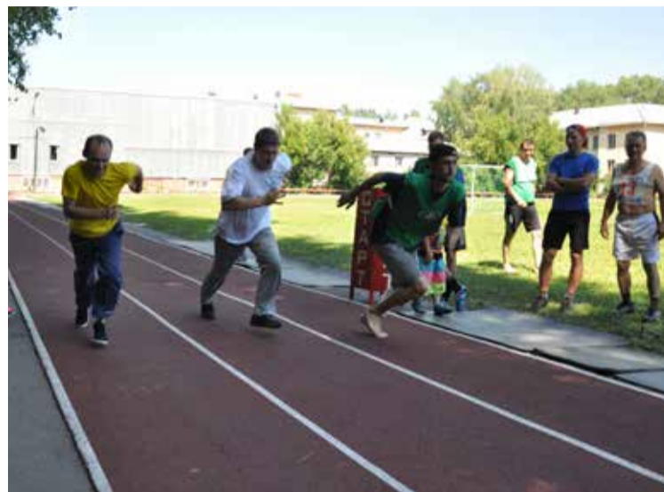
Стартуют мужчины на 400 м