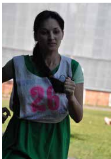
Вперед, к финишу!