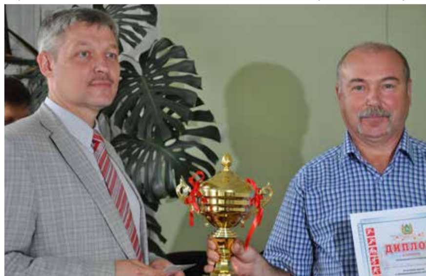
Кубок за победу