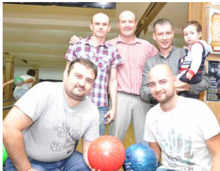
ПКБ ТДСК – сегодня второе