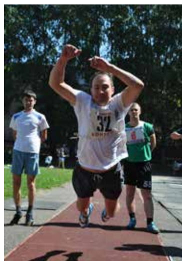
Прыжки в длину