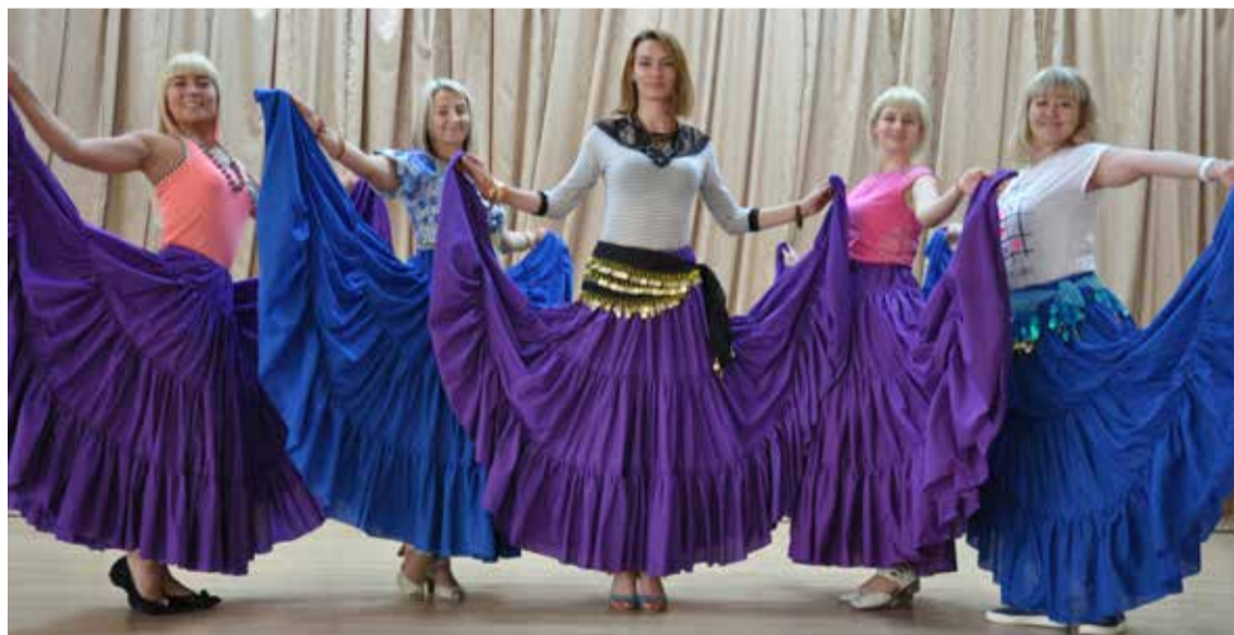
«Цыганочку» исполнили заводские красавицы.