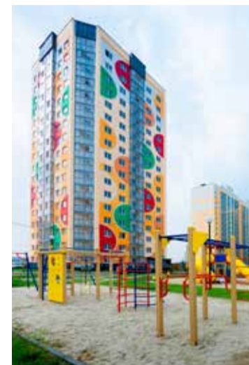
* Ударными темпами застраивается мега-район «Южные Ворота» на 576 тысяч квадратных метров жилья с детским садом и школой.