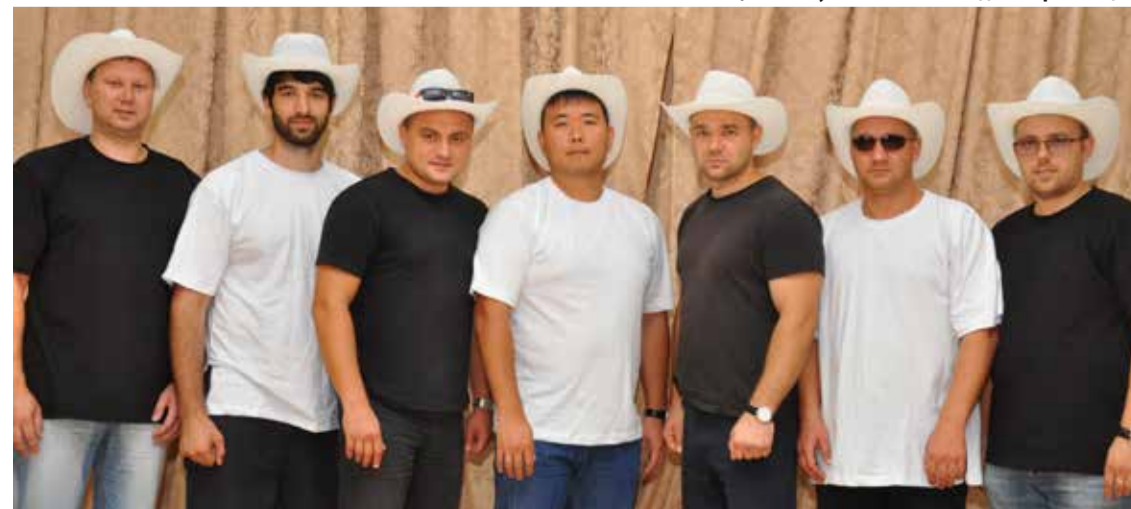
Они готовы исполнить шуточный танец.