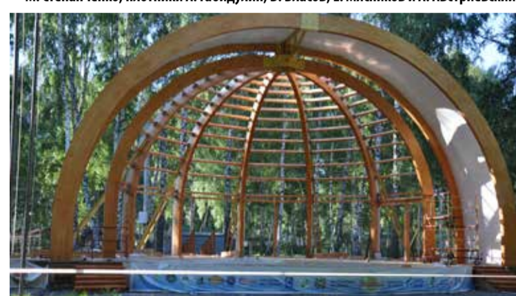
Такой была сцена.

– В прошлом году наших специалистов пригласили обновить сцену для артистов, используя возможность цеха клееного бруса. По проекту сделали огромную деревянную клееную арку, установили её. Но из-за недостатка в финансировании работы приостановили. В нынешнем году возобновили стройку. Новое сооружение очень хорошо вписывается в архитектуру пар-