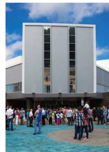
* Компания подготовила окружающую инфраструктуру олимпийский бассейн «Звёздный» к проведению финала Кубка мира по плаванию.