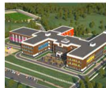
* В микрорайоне Зеленые Горки впервые за 25 лет полным ходом ведётся строительство новой школы на 1100 учебных мест.