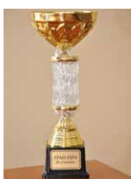
На снимках награды предприятия.

Традиционно состоялось вручение памятных медалей «Доблесть завода» и нагрудных знаков «За особые заслуги перед заводом».