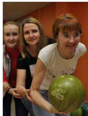
На снимках: лучшие игроки команд с призами и кубками, боулинг – это увлекательно и команда «М-Арт».

Игроки команд, признанные лучшими, награждены памятными призами. Команды ОГАУ «Томскгосэкспертиза» и ООО «Томэкскавация» получили от оргкомитета турнира кубки за 2-е и 3-е места.