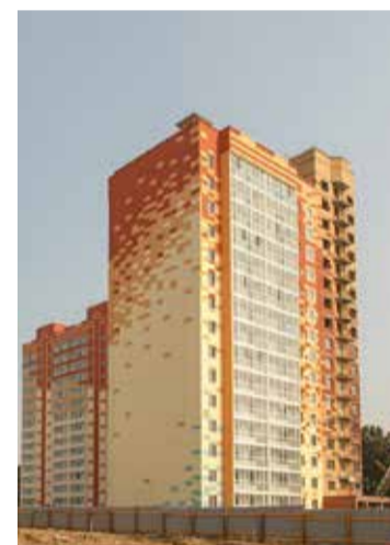
* Заселён первый дом в микрорайоне «Радонежском». В новом микрорайоне планируется построить 250 тысяч кв. м жилья, детский сад и школу.