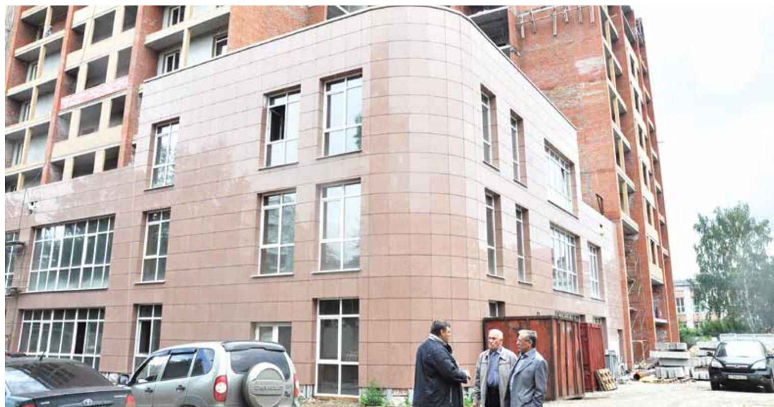
Так выглядит жилой комплекс сегодня