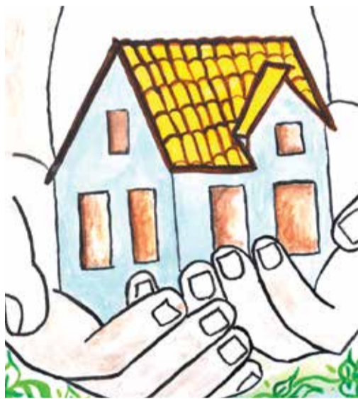
Рисунок Даниила Поносова