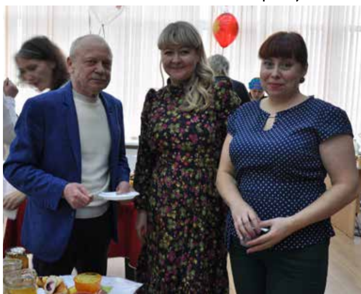
От вкусного варенья хорошее настроение