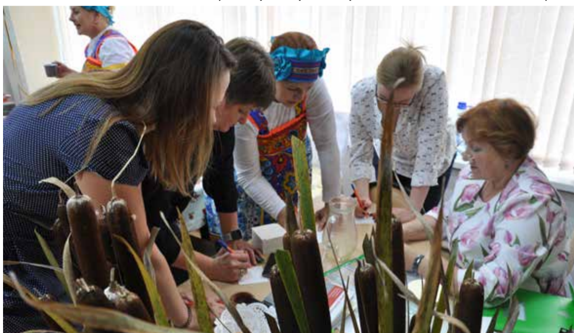
Жюри за работой