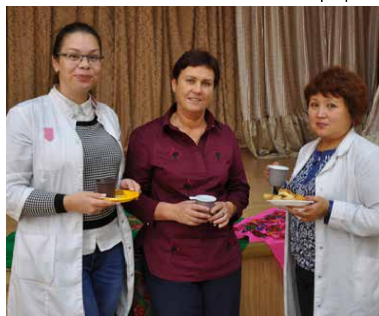
Доктор дал «добро»