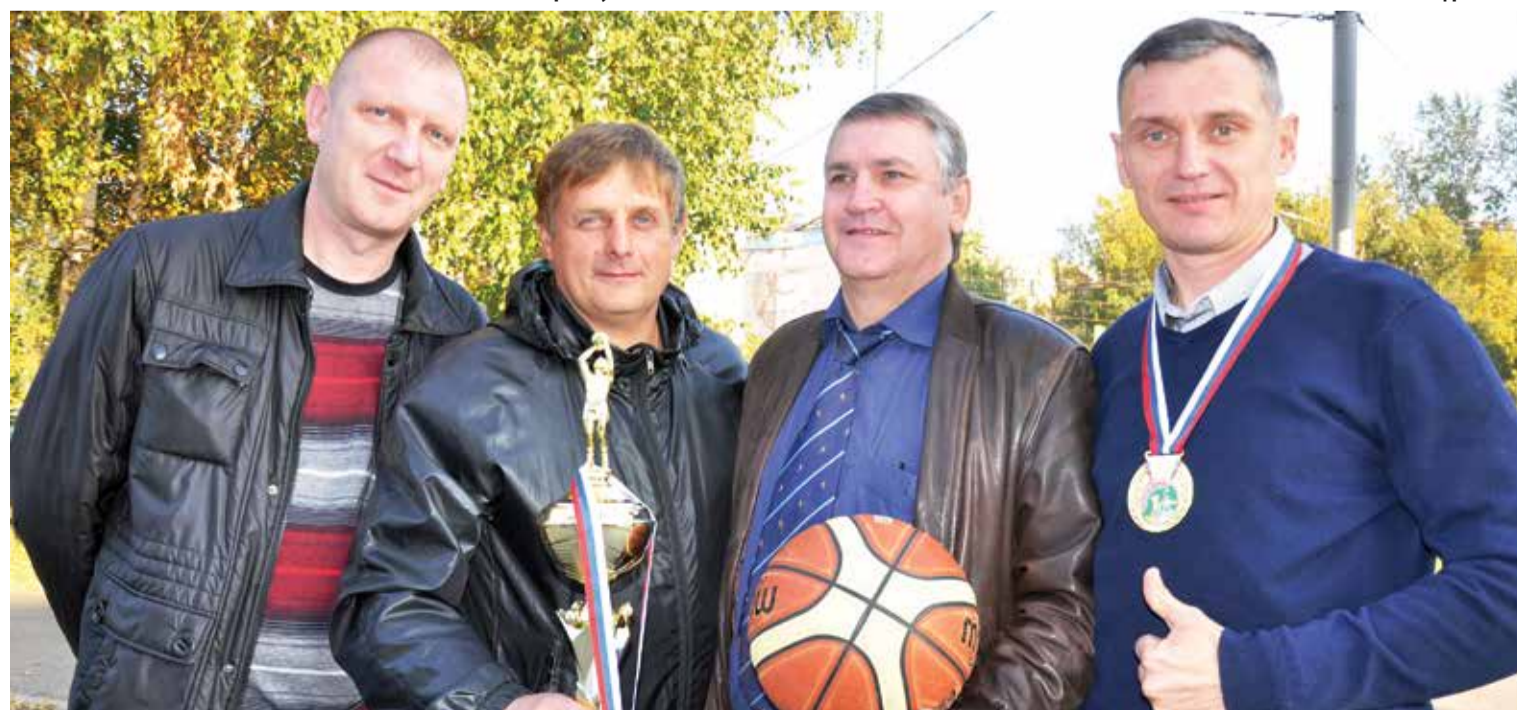
Сборная по стритболу