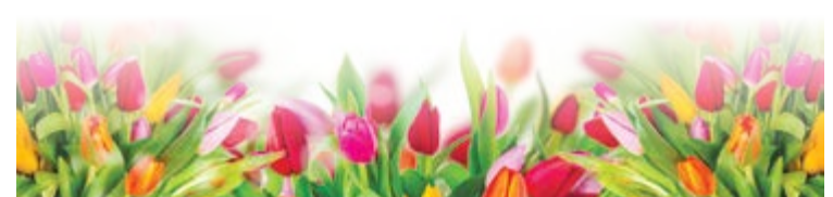
Фото и текст Александра МЕНЧИКОВА

От редакции хочется им всем пожелать душевного спокойствия, успеха, сопутствующего во всём и всегда, доброго здоровья, крепких семейных отношений и счастья, переливающегося через край!