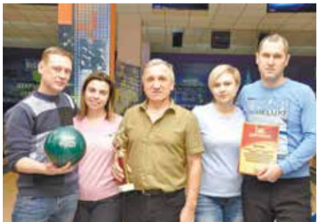
Мы из ГК «Карьероуправление»

23 декабря состоялся традиционный предновогодний турнир по боулингу среди строительных организаций Томска. В нём приняли участие 4 команды.