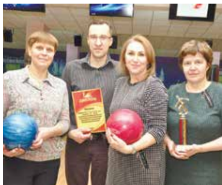
Команда ООО «Томэкскавация»