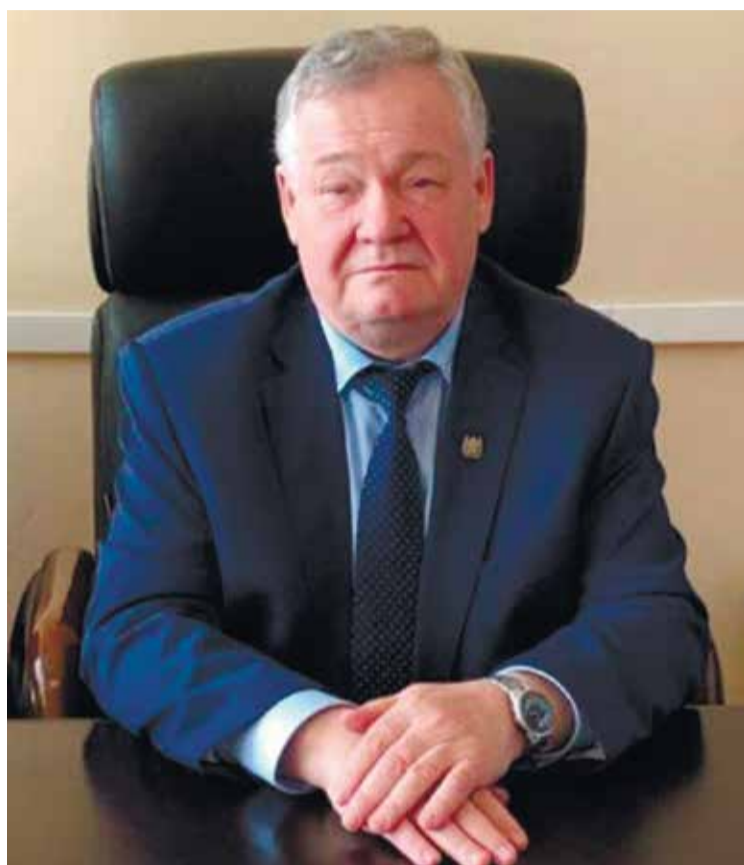
От имени коллектива Томскстата сердечно поздравляю мужчин строительного комплекса Томской области с наступающим праздником Днём защитника Отечества.

Желаю удачи и творческой энергии в претворении в жизнь национальных проектов, всем мужчинам здоровья, счастья, и благополучия!