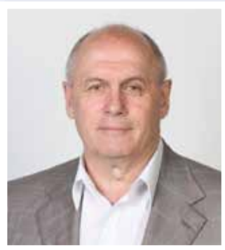
Сергей ЗВОНАРЕВ, заслуженный строитель РФ, президент Союза строителей Томской области, депутат Законодательной думы Томской области

Будьте неповторимы, обаятельны и счастливы!